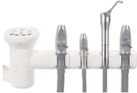
4 konumlu tutucu