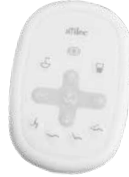
Standart dokunmatik panel