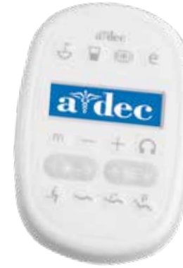
Deluxe dokunmatik panel