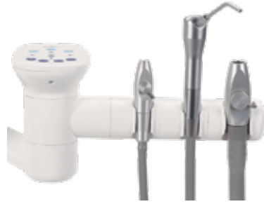
3 konumlu tutucu