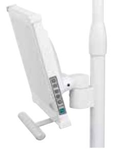
Işık ve monitör kolu