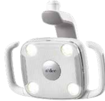
A-dec 300 LED