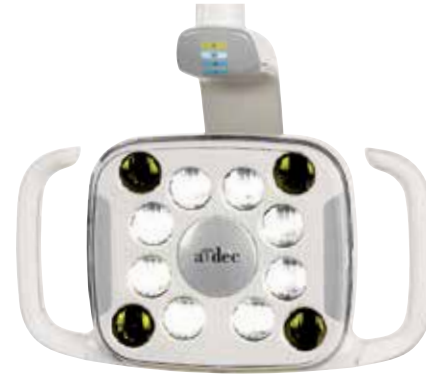
A-dec 500 LED