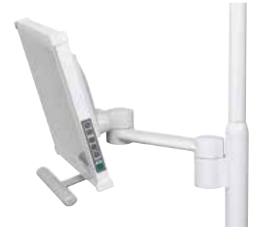
Işık monitörü kolu ve bağlantı kolu