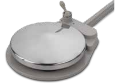
Diskli ayak kumandası