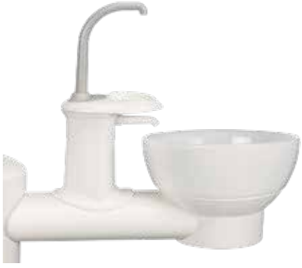
Sabit cam kreşuar