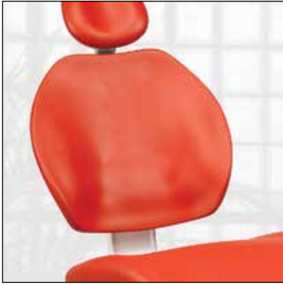
Kolçaksız ve dikişsiz döşeme