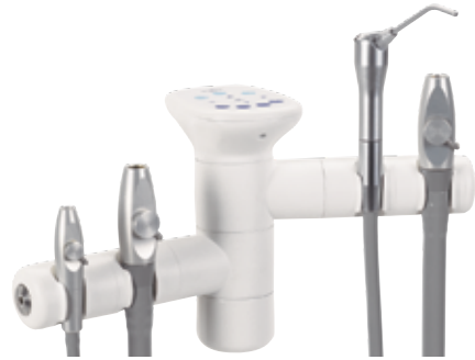
Çift 2 konumlu tutucu