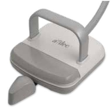
Pedalli ayak kumandası