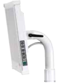
Radius monitör kolu