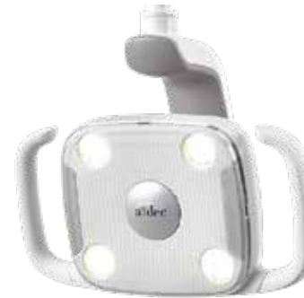
A-dec 300 LED