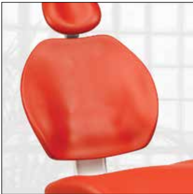
Nahtlose Polsterung ohne Armlehnen