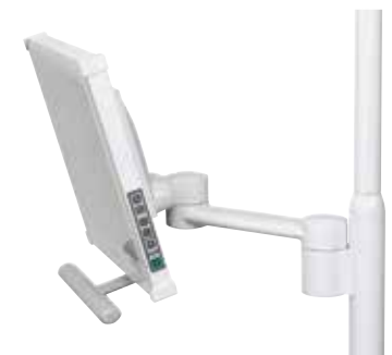
Monitorbefestigung an OP-Lampensäule mit Befestigungsarm