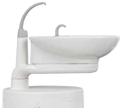
Schwenkbares Speißen aus Glaskeramik