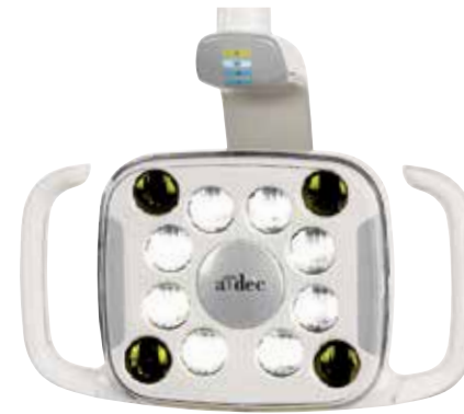
A-dec 500 LED