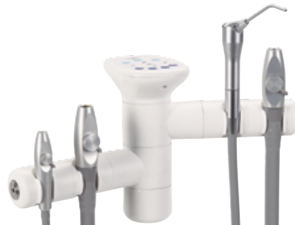
Doppelhalterung mit 2 Positionen