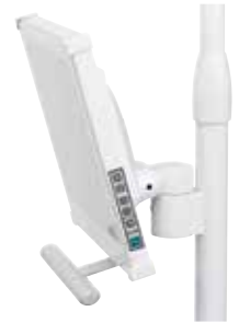
Monitorbefestigung an OP-Lampensäule