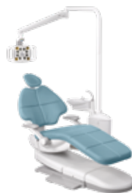
Mocowanie do fotela