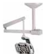
Mocowanie do sufitu