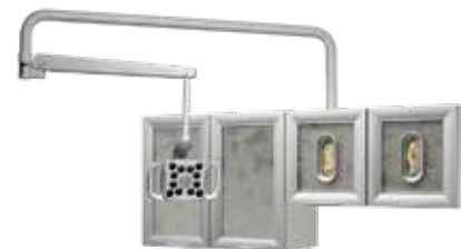
Připevnění ke zdi/skříní