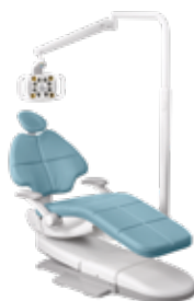
Připevnění ke křeslu Radius®