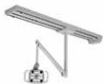
Připevnění ke kolejnici

Všechny možnosti nemusí být k dispozici. Pro bližší informaci o dostupnosti se obraťte na autorizovaného prodejce.