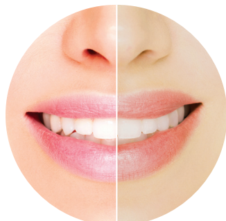
Высокий индекс цветопередачи Источник Снизить индекс цветопередачи Источник

Учитывая высокую способность человеческого глаза к адаптации, клинический эффект использования светильника с более низким ИЦП недостаточно очевиден, однако исследования показывают, что светильники с более высоким ИЦП (т. е. ~90 или выше) способны более полно и точно передать цвет ткани ротовой полости.